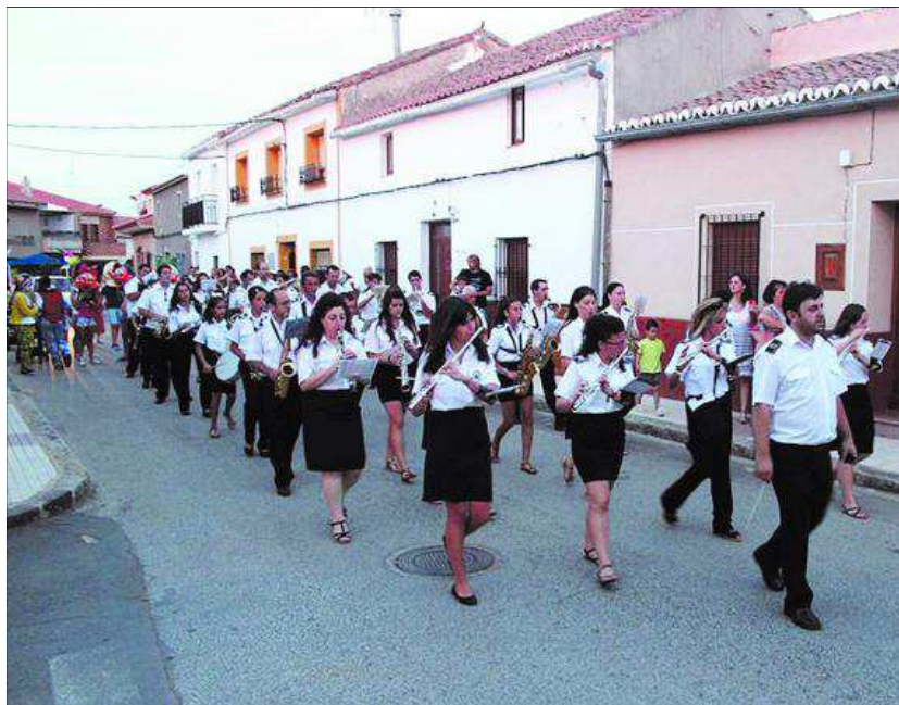
Banda de música, en la apertura de feria.