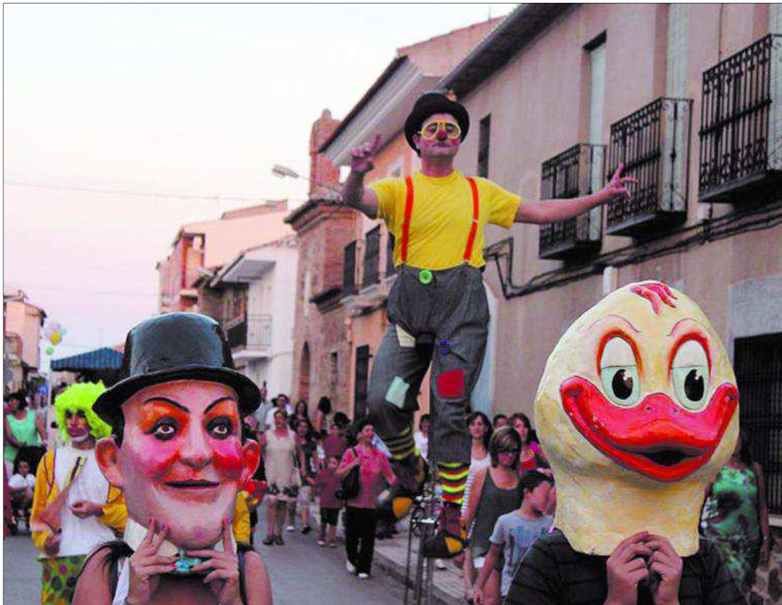
Desfile de gigantes y cabezudos de la Feria y fiestas de 2014.